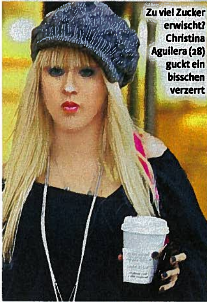
Zu viel Zucker erwischt? Christina Aguilera (28) guckt ein bisschen verzerrt