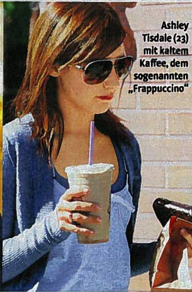
Ashley Tisdale (23) mit kaltem Kaffee, dem sogenannten „Frappuccino“