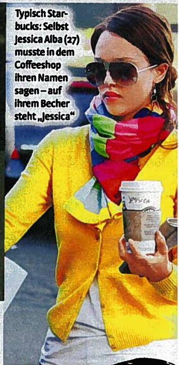
Typisch Starbucks: Selbst Jessica Alba (27) musste in dem Coffeeshop ihren Namen sagen – auf ihrem Becher steht „Jessica“